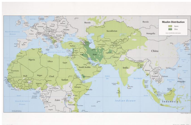
Gambar 1. Negara-Negara Mayoritas Muslim

Maka dari itu, melihat belum adanya keberhasilan menyatukan umat daripada kaedah-kaedah pembangunan taqvim yang ada masa ini, Kaedah Rukyah Muhaqqah hadir dengan pedoman pertamanya menjadikan kepentingan menyatukan umat melalui taqvim sebagai perkara maqasid syariah. Maka dari itu, untuk merealisasikannya konsepnya ada salah satu usaha dalam pedoman hubungan dan kaitannya السواد العظم dan kesatuan Matla’. Konsep ini menjelaskan dengan meletakkan peta kawasan dunia keatas garis lunar antarabangsa, kemudian menyatukan kawasan negara-negara mayoritas umat Islam kedalam garis darajah yang telah ditentukan. 38